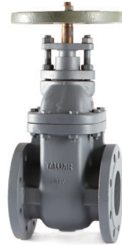
MG670-N 2" - 24"